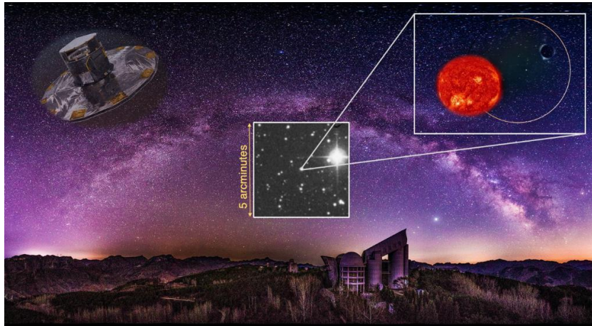
图 1: G3425 双星想象图，包含一颗可见的红巨星和一颗看不见的小质量恒星级黑洞（王松绘制）

近 60 年来，天文学家基于传统 X 射线方法已经证认并测量了 20 余颗恒星级黑洞的质量，其质量分布显示为缺少 3—5 倍太阳质量的黑洞，这一区间被称为黑洞质量间隙。这与黑洞形成理论的预期——小质量黑洞数量远多于大质量黑洞——大相径庭。天文学家试图通过修改超新星爆炸理论来解释该质量间隙，也有研究认为超新星爆炸会更容易瓦解包含小质量黑洞的双星系统，从而导致了这一观测效应。尽管近年来激光干涉引力波天文台（LIGO）的观测揭示了黑洞质量间隙内存在致密天体，然而，小质量黑洞是否可以存在于双星系统中仍然是一个备受争议的问题。这类系统中的双星很可能无相互作用（如物质传输），因此没有 X 射线辐射，但可以通过视向速度和天体测量方法进行搜索。