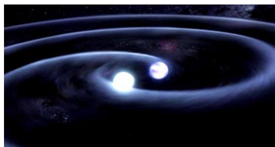
图 2 双星示意图 (NASA)

研究人员利用交叉相关函数的方法，对 LAMOST DR7 的中分辨光谱进行了视向速度的测量，找出了拥有两个或三个视向速度成分的光谱。最终证认出了 3000 多颗光谱双星和三星系统，并给出了不同观测时刻各子星的视向速度值。得益于 LAMOST 时域巡天项目，这些被证认出的多星系统中超过 2500 个目标包含了多次观测的数据，其中 525 颗光谱双星和 31 颗三星被观测了至少 6 次。