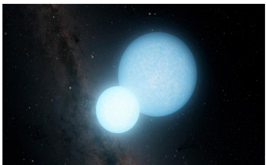
图 4 白矮星示意图 (Caltech / IPAC)

近期，国家天文台孔啸博士、罗阿理研究员基于 LAMOST 光谱数据在 Gaia 数据的白矮星候选体样本中证认出 6190 颗白矮星，其中 1920 颗是首次发现的，并包含了 64 颗激变变星。并对证认出的白矮星样本进行了细致分类和大气参数测量。该工作体现了 LAMOST 大样本光谱数据集在证认测光巡天中大量特殊天体的独特优势。该数据集大大丰富了已有的白矮星样本，这为深入研究白矮星的形成和演化机制以及追溯恒星内部特征和形成演化等前沿课题提供了更加完备的资源。